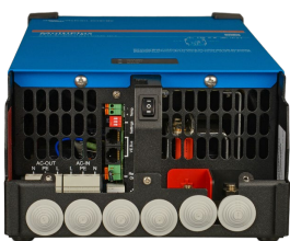
MultiPlus 2000 VA (alakansi irrotettuna)